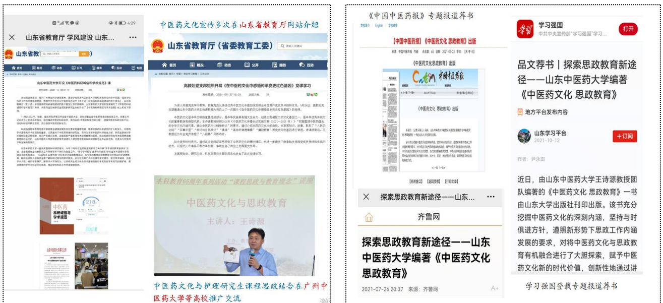
图1 我校课程思政与护理专业教育融合实践的多方报道宣传

依托中医药院校的浓厚中医药文化底蕴，“文德术”并重，有机地进行了中医药文化、思政教育、护理人文素养等元素与护理专业课程的有机结合，编著《中医药文化 思政教育》一书，挖掘中医药文化的深刻内涵，使学生在学习的过程中潜移默化地将爱国主义情怀，民族文化自信与护理职业道德人文素养、学术道德、社会主义核心价值观等融合，外化于行，内化于心。“学习强国”“齐鲁网”和山东省教育厅网站，对我校在护理专业教育过程有机地进行了中医药文化、思政教育、护理人文素养等元素有机融入进行了多方报道宣传（图1）。